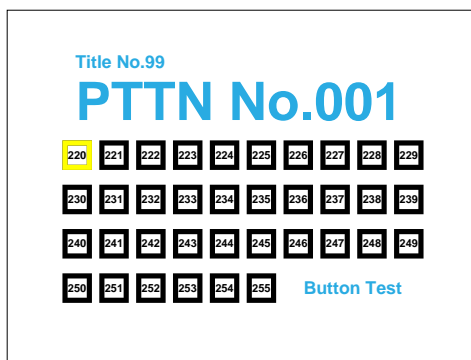
タイトル99、チャプタ1(PTTN1)再生画面