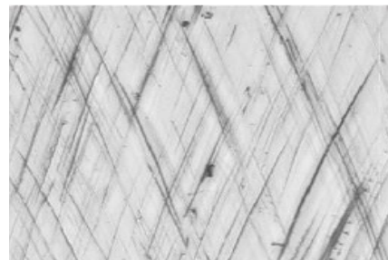
参考 クラウドスクラッチ拡大図