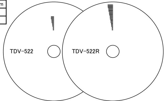
スクラッチのイメージ図 (読み取り面側)